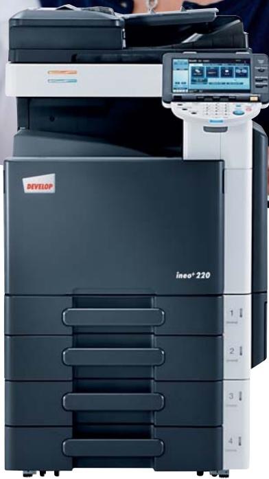
ineo+ 220 mit Originaleinzug (DF-617) und 2x 500 Blatt Papierkassette (PC-207)