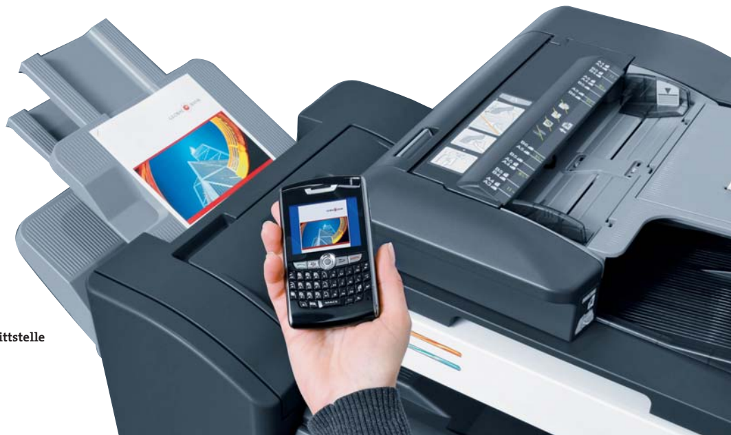
Mobiles Drucken über optionale Bluetooth-Schnittstelle