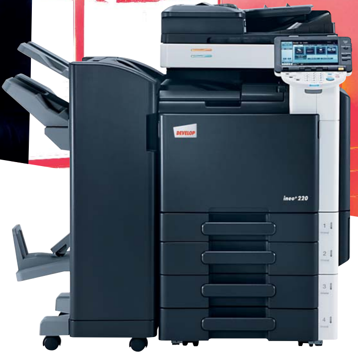
ineo+ 220 mit Originaleinzug (DF-617), Standfinisher (FS-527), Rücksticheinheit (SD-509) und 2x 500 Blatt Papierkassette (PC-207)