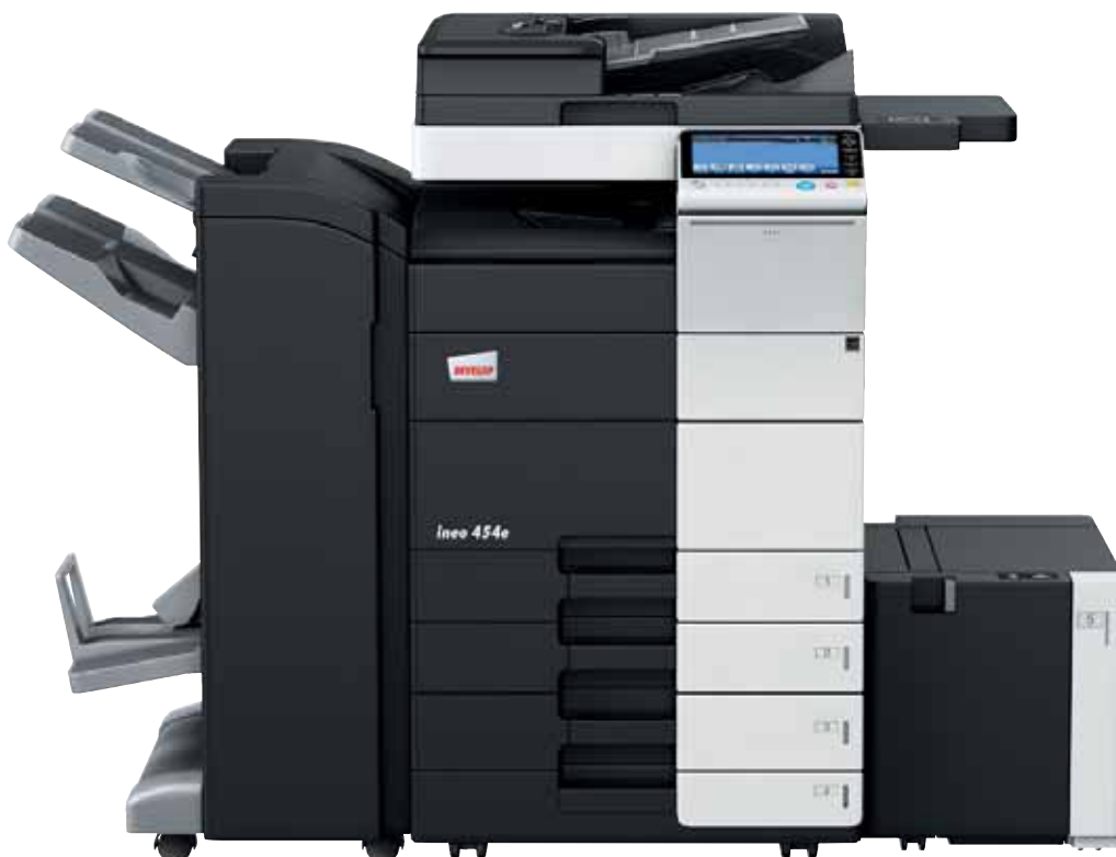
ineo 454e mit Heft- und Broschüren- finisher (FS-534SD), Papierkassette (PC-210), Großraumkassette (LU-301) und Ablagetisch (WT-506)

Jedes dieser Multifunktionssysteme – ineo 224e, ineo 284e, ineo 364e, ineo 454e und ineo 554e – ist einfach zu bedienen und hat eine große Bandbreite zusätzlicher Funktionen, die die tägliche Arbeit im Büro entscheidend erleichtern. Wenn beim Drucken, Kopieren und Scannen Zeit gespart wird, bleibt mehr Zeit für die eigentlichen Kernaufgaben – und das steigert die Produktivität im Büro.