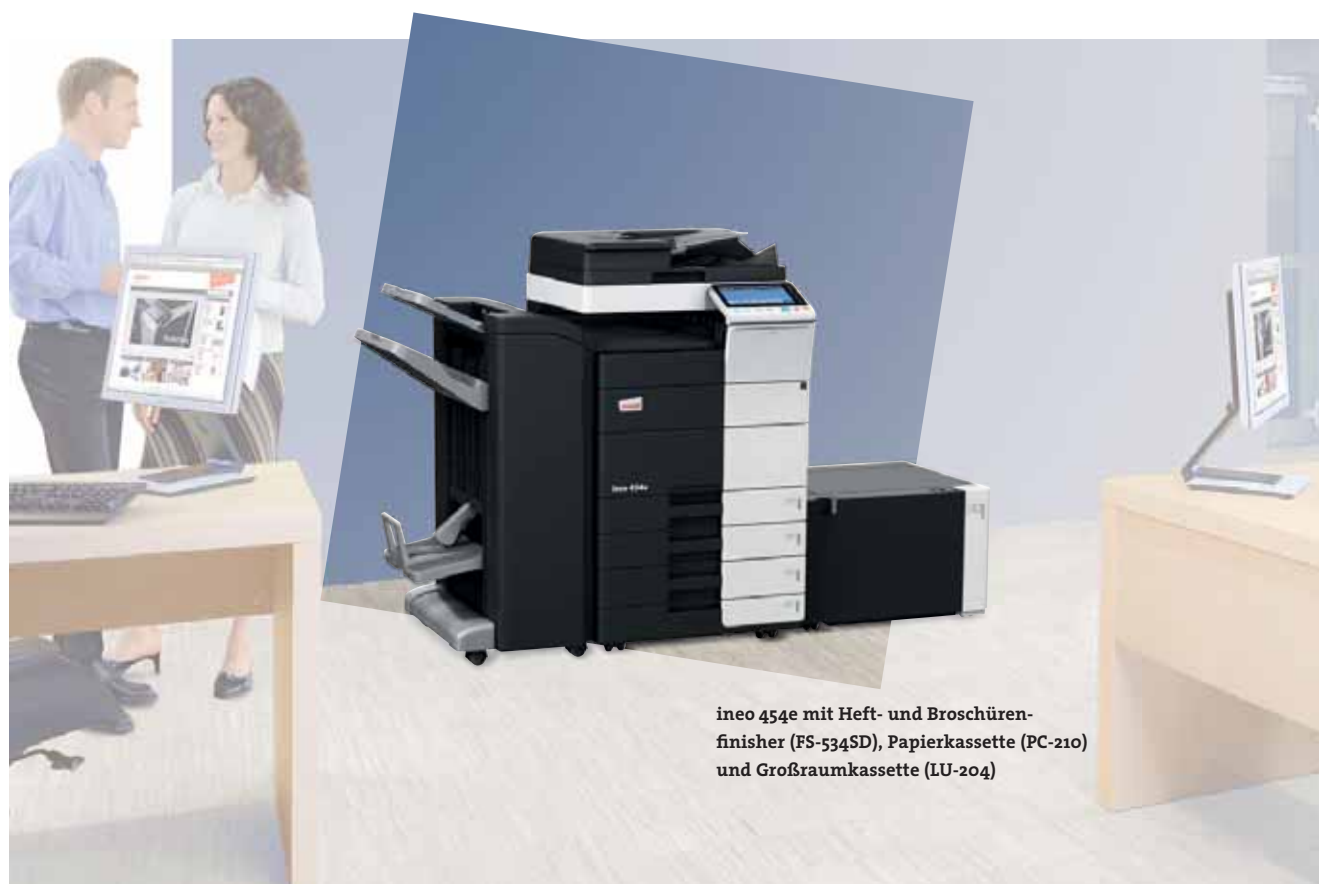
ineo 454e mit Heft- und Broschürenfinisher (FS-534SD), Papierkassette (PC-210) und Großraumkassette (LU-204)

Zahlreiche Energiesparmaßnahmen sorgen bei den ineo Schwarzweißsystemen dafür, dass der Energieverbrauch um bis zu 40 Prozent unter denen der Vorgängermodelle liegt. Das spart zum einen Geld, hilft aber auch der Umwelt. Die neue ineo e-Serie ist nicht nur gut für das Unternehmen, sondern verbessert auch dessen ökologischen Fußabdruck.