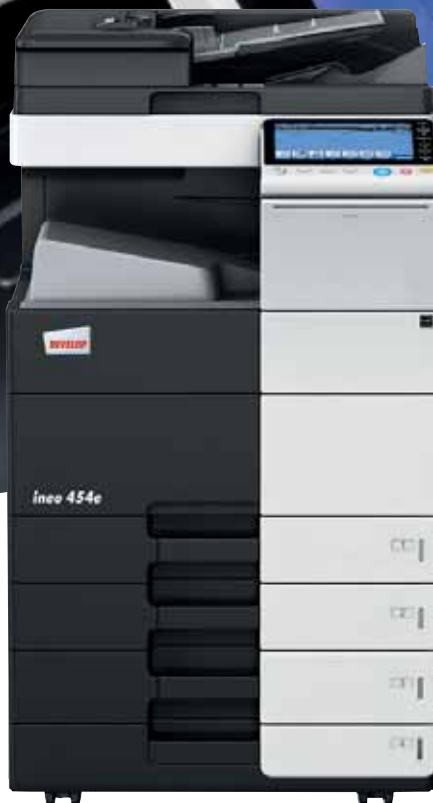
ineo 454e mit Papierkassette (PC-210), Ablagetisch (WT-506) und Ausgabefach (OT-506)